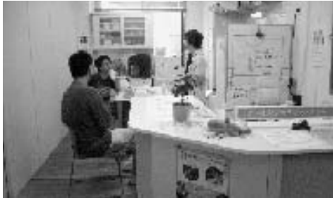
自立に向けての足場づくり

への出にくさを感じてしまうという二次的な現象が現れていることが多いと思います。とにかくアルバイトでも何でも社会へ飛び出してみる、ということすらできないほど社会や人への信頼感が失われているという状態です。 私たちは彼らが社会や人への信頼を回復していくために、同じサポートステーションに通う若者たちや働く人、職場、地域との「出会い」を活用しながら若者たちの自立に向けての足場づくりを進めています。同時に、若者が社会参加していくために必要な仕組みづくりも求められています。